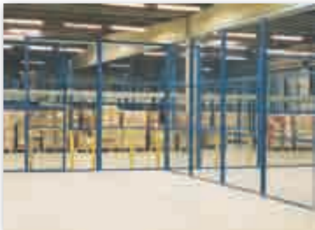
For the stock management areas. Bereiche zur Vorbereitung der Bestellungen. Zonas de preparación de pedidos.