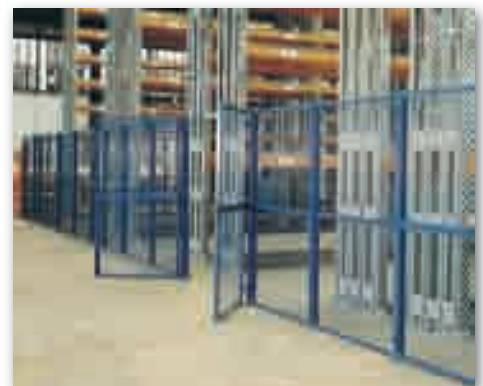
Safe and secure the hazardous storage areas. Zugang zu gefährlichen Lagerbereiche. Acceso a las zonas de almacenaje con riesgo.