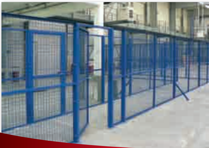
For safety of the traffic lanes. Schutz der Laufgänge Protección de los pasillos de circulación.